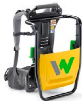
Akku-Umformer-Rucksack ACBe Artikelnr.: 5100058345

Das als Rucksack tragbare, akkubetriebene Innenrüttlersystem garantiert dem Anwender maximale Flexibilität auf der Baustelle bei der Betonverdichtung. Vor allem beim Arbeiten auf Schalungen und Gerüsten profitiert der Bediener von einer großen Bewegungsfreiheit und einem unbeschränkten Arbeitsradius, da er kein Kabel mitziehen muss.