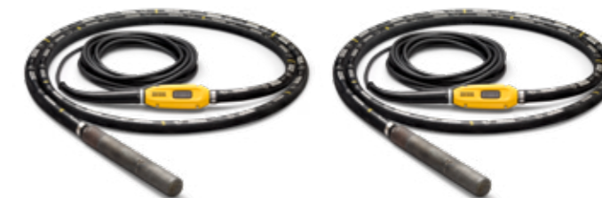
Frequenzumformer FUH35 Artikelnr.: 5100063670