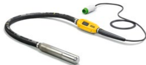
Innenrüttler IEe58 Flaschengröße 58 mm Artikelnr.: 5100049833