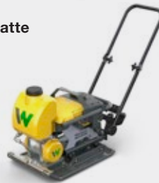
Akku-Vibrationsplatte AP1850we 5100038311