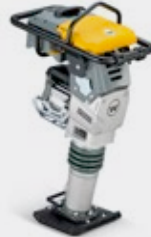
Akku-Stampfer AS50e 5100053792