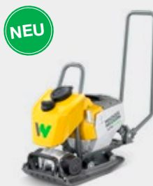
Akku-Vibrationsplatte APS1135e 5100059664