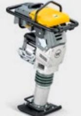
Akku-Stampfer AS60e 5100052267