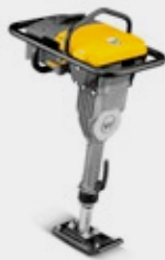
Akku-Stampfer AS30e 51000026851

Zusätzlich bis zu 800,- € BG Bau Förderung**