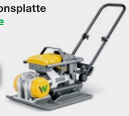
Akku-Vibrationsplatte AP2560e 5100048488