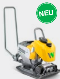
Akku-Vibrationsplatte APS1340e 5100060128