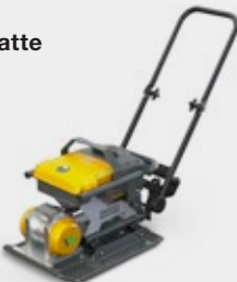
Akku-Vibrationsplatte AP1850e 5100038319